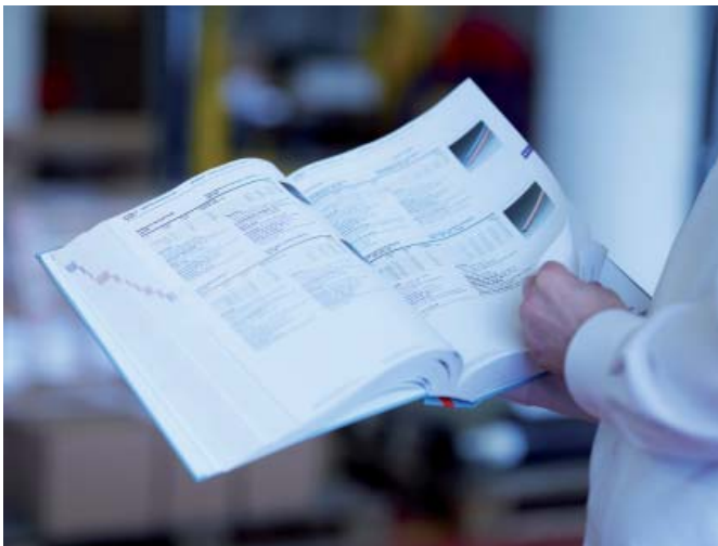
Produktkatalog mit 2000 Seiten