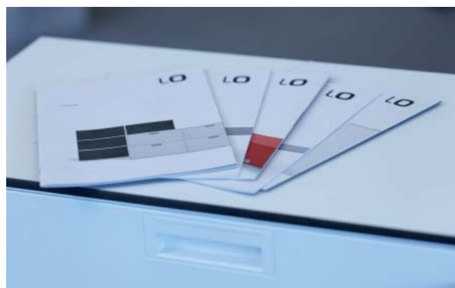
Kataloge Lista Office

Bei Lista Office stehen noch weitere Printprodukte zur Umsetzung an. Fabio Balducci dazu: „Wir haben das Potential der asimSuite längst erkannt und werden künftig weitere Möglichkeiten nützen. Schließlich ist unser Ziel, immer noch mehr Nutzen für unsere Kunden anzubieten.“