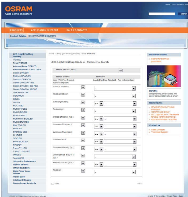
Der OSRAM Produktkatalog online, http://catalog.osram-os.com