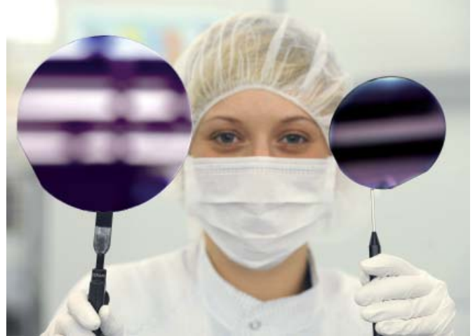
OSRAM Opto Semiconductors stellt Fertigung bei InGaN-Chips auf 6-Zoll-Scheiben um

Die asimSuite ist eine Premium Software für das Produktinformationsmanagement, mit der Anwender die Verwaltung ihrer Produktdaten und die Informationsbereitstellung deutlich vereinfachen können. Sie verfügt über zahlreiche Module, mit denen Anwender die Bereiche Katalogmanagement, Fremdsprachenmanagement, Grafik-/Bilddatenmanagement und Contentmanagement abdecken können. „Das System hat unsere Anforderungen am besten erfüllt. Es überzeugte vor allem durch Vielseitigkeit und umfassende Datenpflegefunktionen“, sagt Becht. So ist es möglich, in asimBase – dem Basismodul der asimSuite – Produkthierarchien aufzubauen, die dabei helfen, den Pflegeaufwand zu minimieren. Über eine Vererbungsfunktion können Produkten bestimmte Eigenschaften von der übergeordneten Hierarchie automatisch zugeordnet werden. Aber auch in anderen Bereichen, wie beispielsweise Importmöglichkeiten oder Performance bei der Generierung der Publikationen, überzeugte asim.